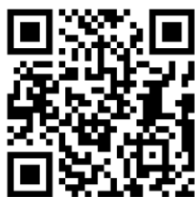
中国投资者网网站链接 (扫码并访问，可多次扫码)

为更好地统计各上市公司的点击量和关注量，请大家将网站和公众号链接二维码（附后）作为推广码。感谢大家的大力支持！ 特此通知！